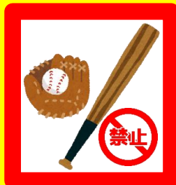
■バット・硬いボール

※バーベキュー利用者のいる時間帯での下記の行為を禁止しています。 ※その他、スタッフが危険またはほかのお客様の迷惑になっていると判断した場合はお声掛けをします。指示に従ってください。