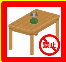
■公園のテーブル・イスの上での火器の使用

※過去にも他の店舗で爆発事故が発生しております。 ※アウトドア用のバーナー及び屋外用カセットコンロはその限りではありません。