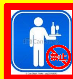
■ケータリング禁止。

※イベント・余興など特別なご利用の場合は必ず事前にご連絡ください。 ※その他音響機器は隣のサイトに響かない位の音量でご利用ください。