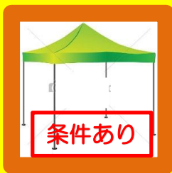
■4本足フレームタープ