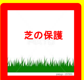
■芝の保護について

飲み残しは捨てない。 大量の水を流さない。 熱い鉄板等を置かない。 火のついた炭を捨てない。